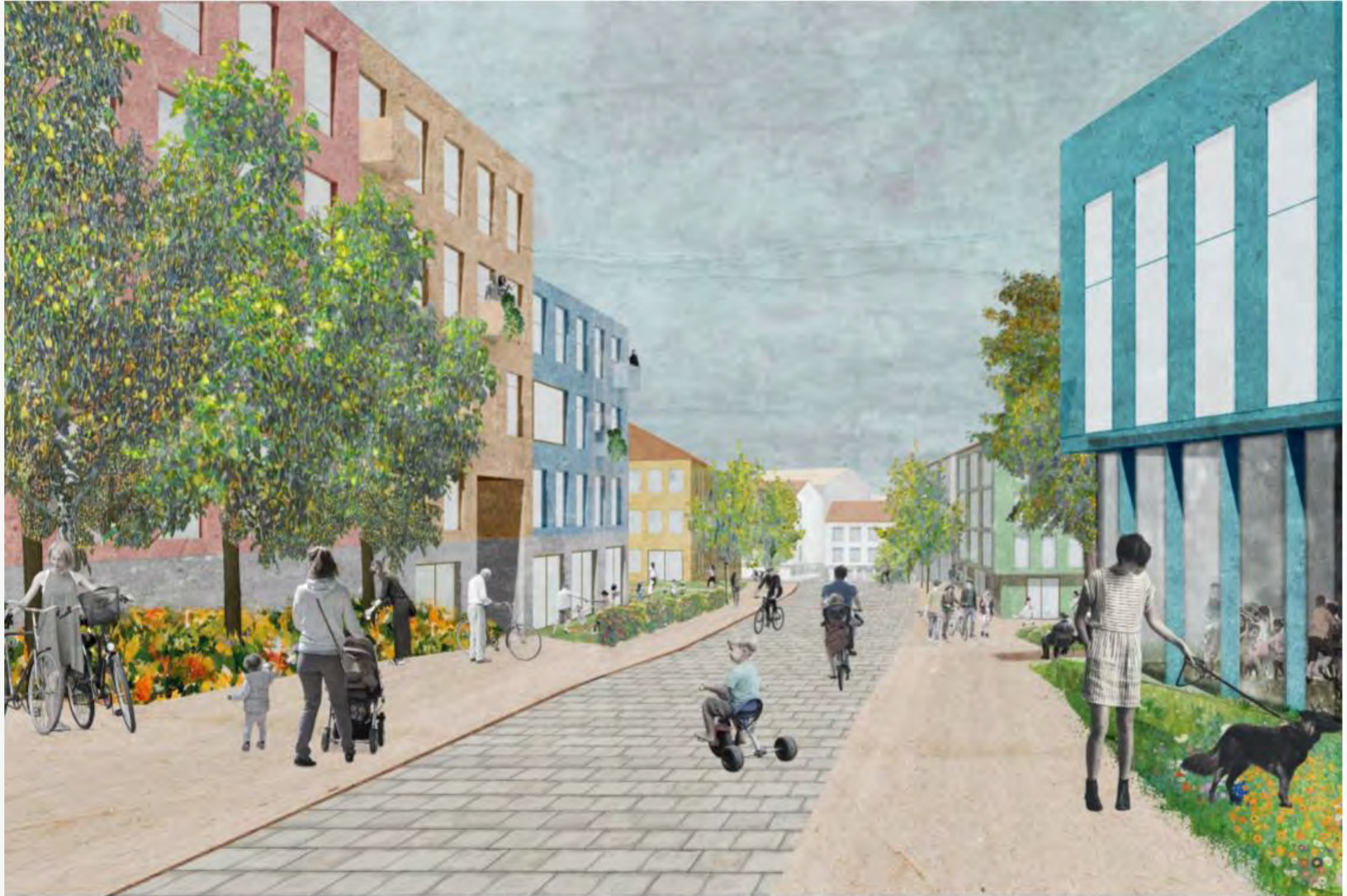
Bollggate I forlengelse av Høviksvingen